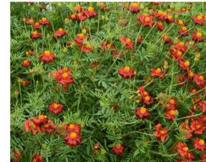
Tagetes innehåller ämnen som tar livet av nematoder, och genom att mylla ner vissna tagetes runt rosorna håller de sig friskare.

rosorna håller sig friskare. Beskär inga rosor nu, vänta till våren.