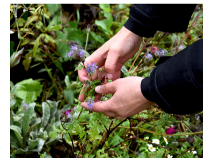
Vissna sommarblommor kan komma till nytta som jordförbättring i kruka.